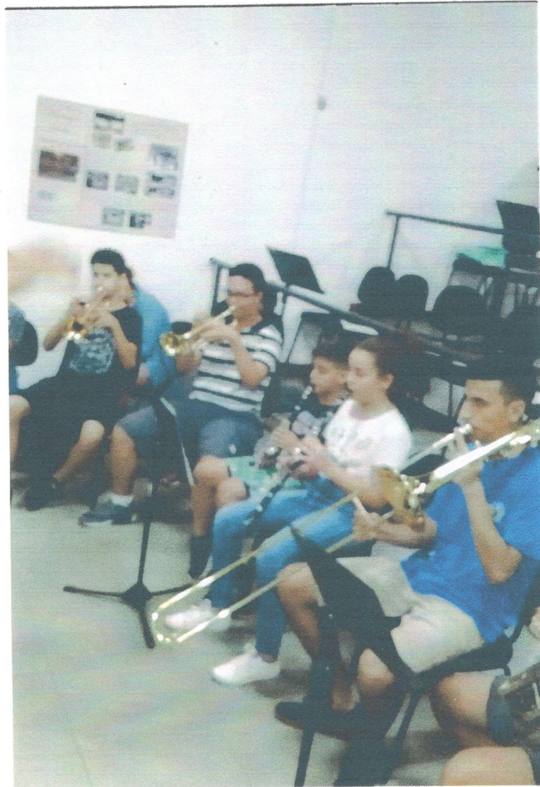
Ensaio para Adoração de Presépio Dez/19